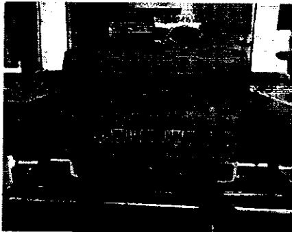
Placa de características