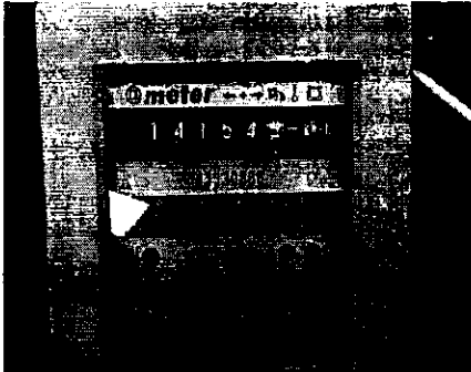
Placa de características