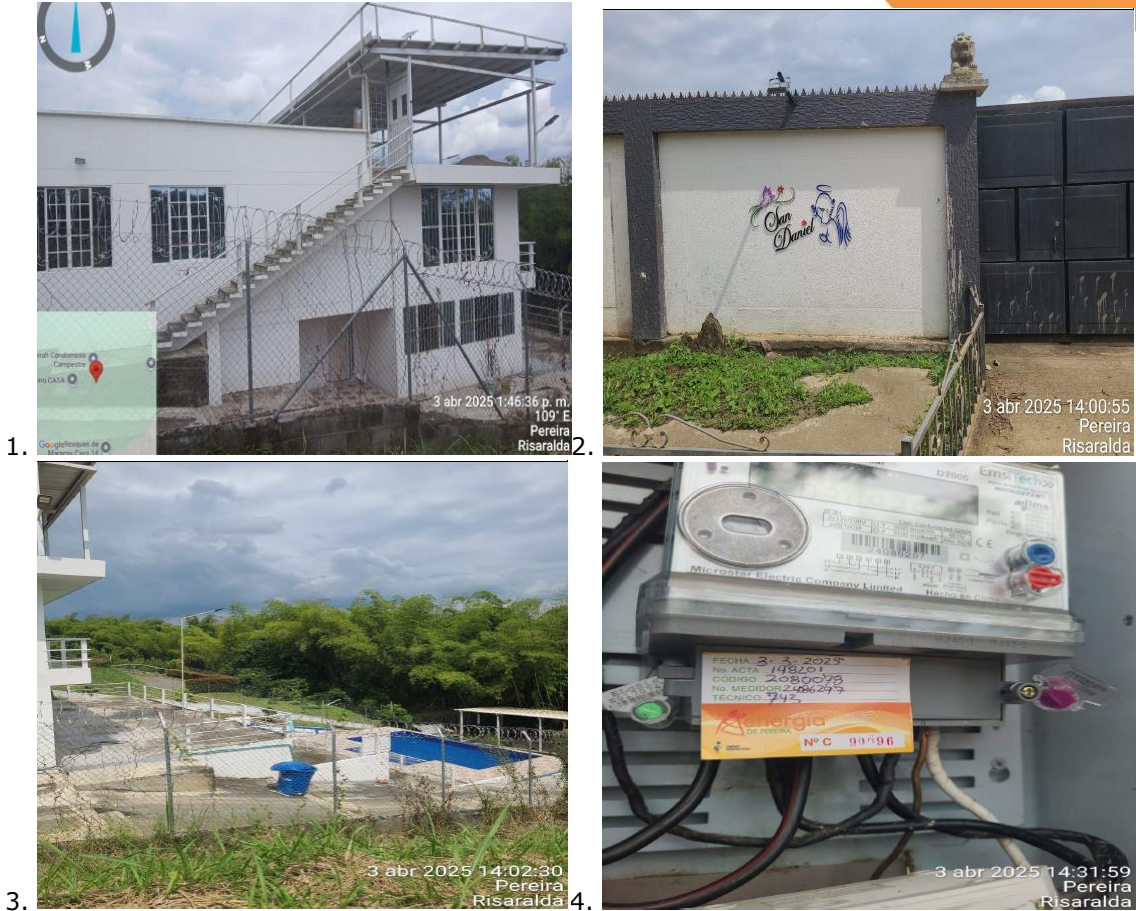
Fotografías No. 1, 2, 3 y 4 vinculan la matrícula con el predio