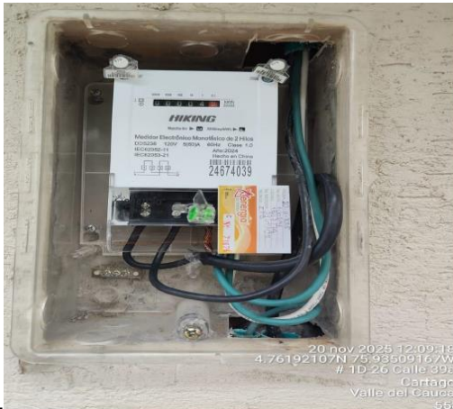
Foto No. 3. Se evidencia el deterioro de los elementos del medidor.