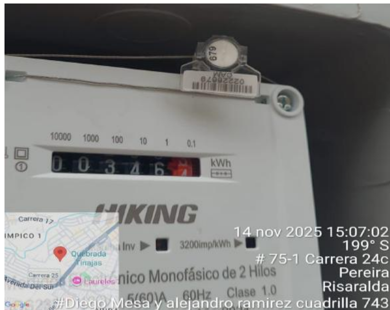
Fotos No 2 y 3. Medidor No. 24712539 encontrado en terreno instalado y energizado sin encontrarse registrado en el sistema comercial de la compañía con una lectura acumulada de 346 kWh.