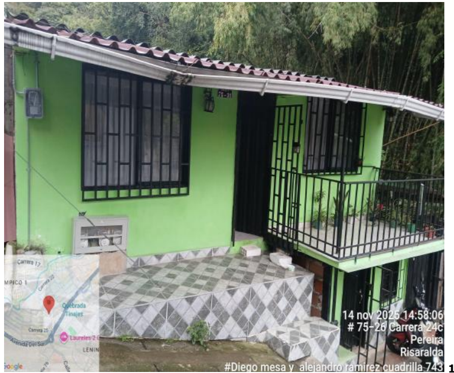
Foto No 1. Vincula el predio con la matricula en revisión