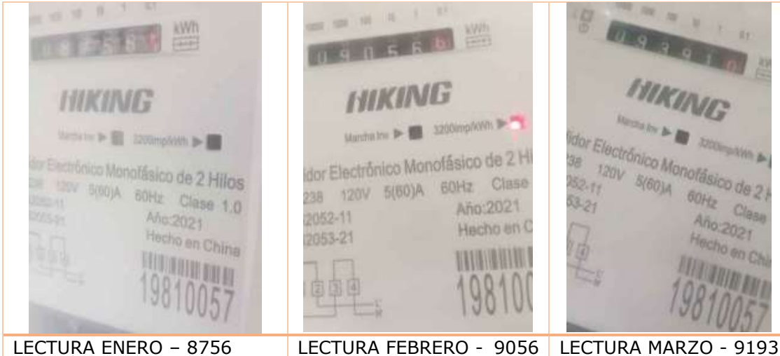
LECTURA ENERO – 8756