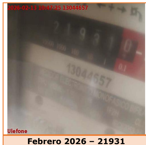
Febrero 2026 – 21931

Segundo: Para febrero de 2026 se reportó lectura 21931 siendo la diferencia de lecturas de 257 kWh . Este considerable aumento representa una desviación significativa del consumo de acuerdo con lo establecido en el anexo del CONTRATO PARA LA PRESTACIÓN DEL SERVICIO PÚBLICO DOMICILIARIO DE ENERGÍA ELÉCTRICA CON CONDICIONES UNIFORMES DE EMPRESA DE ENERGÍA DE PEREIRA S.A E.S.P.; modificado por la RESOLUCIÓN 105 007 DE 2024, por ende, debe ser investigado por la compañía, tal y como lo señala el artículo 149 de la ley 142 de 1994.