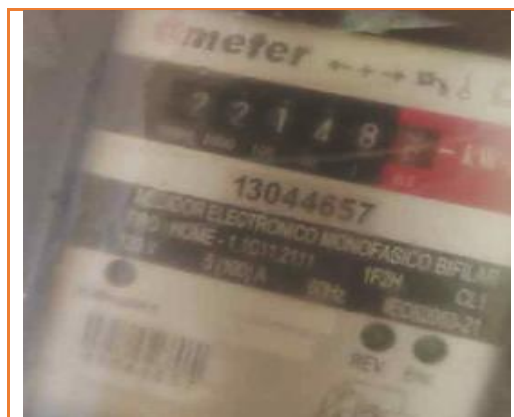
Lectura reportada 16/03/2026

Cuarto: Posteriormente se reportó lectura 22148 propia del mes de marzo de 2026, siendo la diferencia de lectura con la facturada el mes anterior de 217 kWh . A los que se sumó los saldos congelados por la investigación del incremento en el consumo, los cuales corresponden a 157 kWh de febrero 2026, dando un total de 374 kWh.