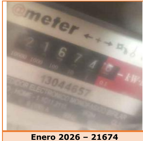
Enero 2026 – 21674

Segundo: Para febrero de 2026 se reportó lectura 21931 siendo la diferencia de lecturas de 257 kWh . Este considerable aumento representa una desviación significativa del consumo de acuerdo con lo establecido en el anexo del CONTRATO PARA LA PRESTACIÓN DEL SERVICIO PÚBLICO DOMICILIARIO DE ENERGÍA ELÉCTRICA CON CONDICIONES UNIFORMES DE EMPRESA DE ENERGÍA DE PEREIRA S.A E.S.P.; modificado por la RESOLUCIÓN 105 007 DE 2024, por ende, debe ser investigado por la compañía, tal y como lo señala el artículo 149 de la ley 142 de 1994.