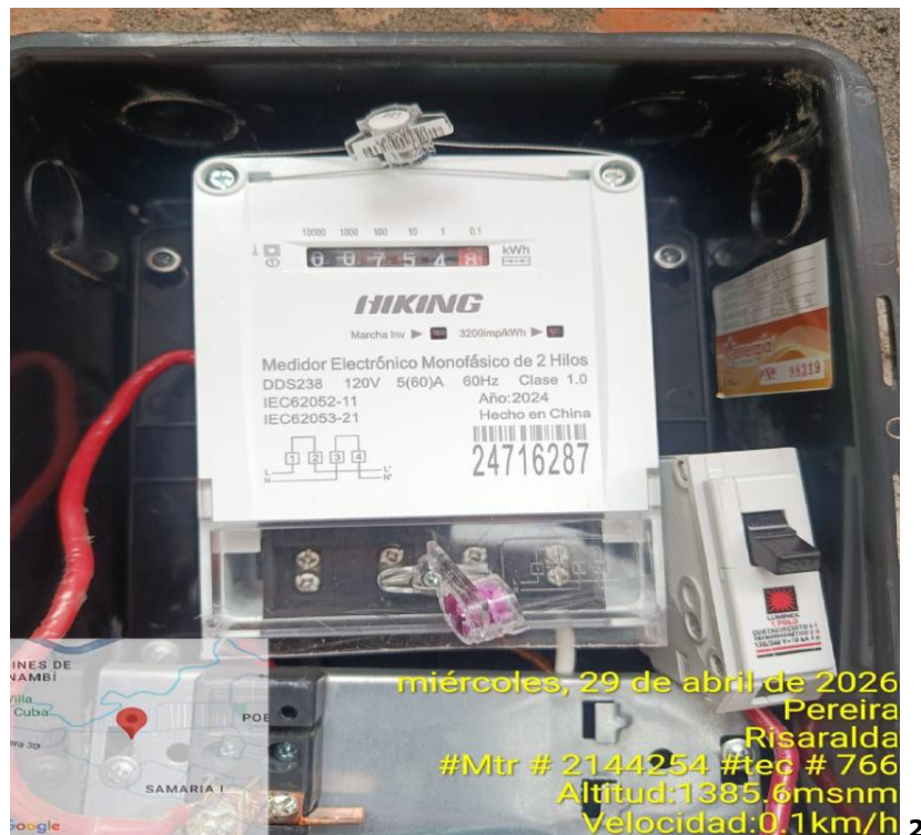
Foto No 2. Medidor No. 24716287 encontrado en terreno instalado y energizado sin encontrarse registrado en el sistema comercial de la compañía con una lectura acumulada de 754 kWh.