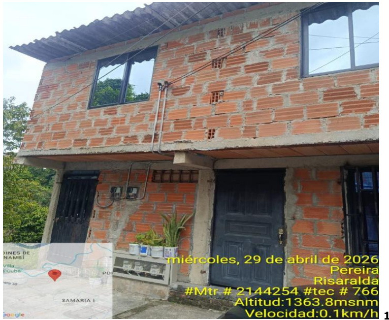
Foto No 1. Vincula el predio con la matricula en revisión